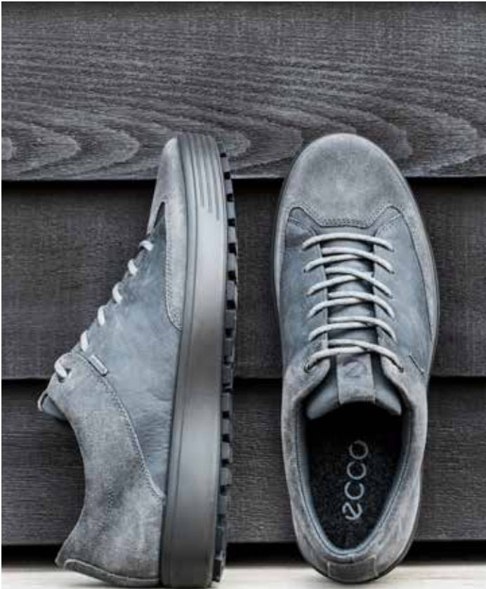
ECCO SOFT 7 TRED M robuuste sneaker | high-quality suède en nubuckleer GORE-TEX waterproof constructie | uitneembaar voetbed 139 95