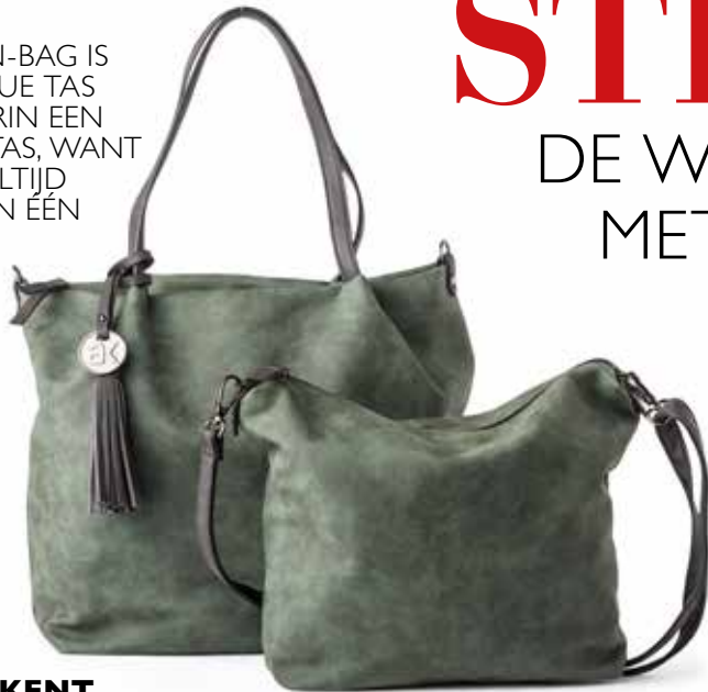
ASHLEY KENT BAG-IN-BAG

verkrijgbaar in 7 kleuren: zwart, blauw, rood, grijs, taupe, groen en roze 49 95