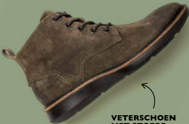
VETERSCHOEN MET STOERE LOOK EN STEVIGE RUBBEREN ZOOL