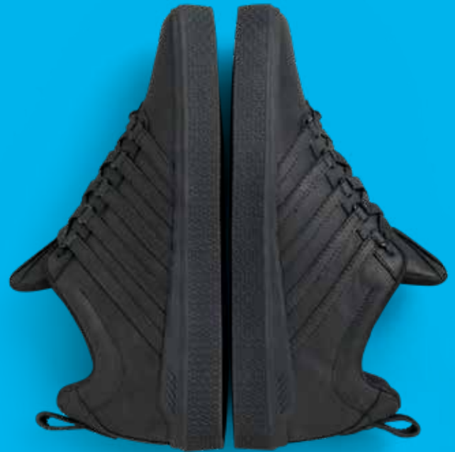
K-SWISS M DONOVAN leren sneaker uitneembaar voetbed