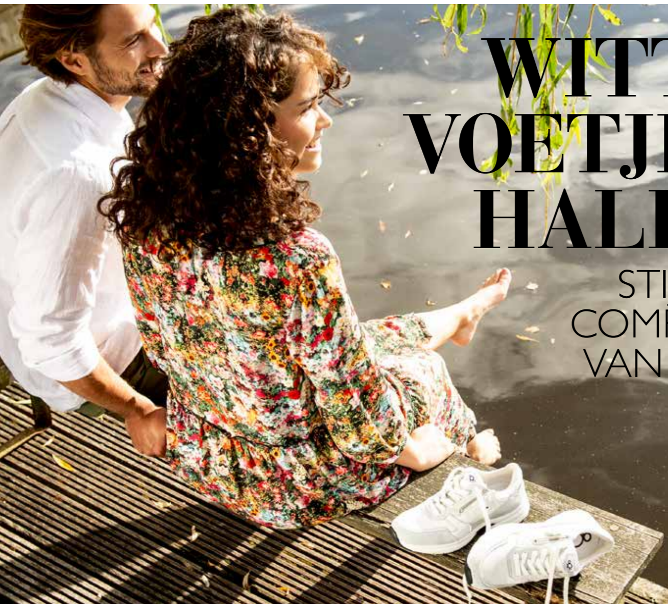
AQA SNEAKER leer & suède | functionele rits uitneembaar voetbed