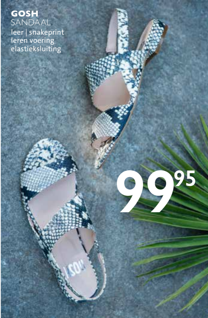
GOSH SANDAAL leer | snakeprint leren voering elastieksluiting